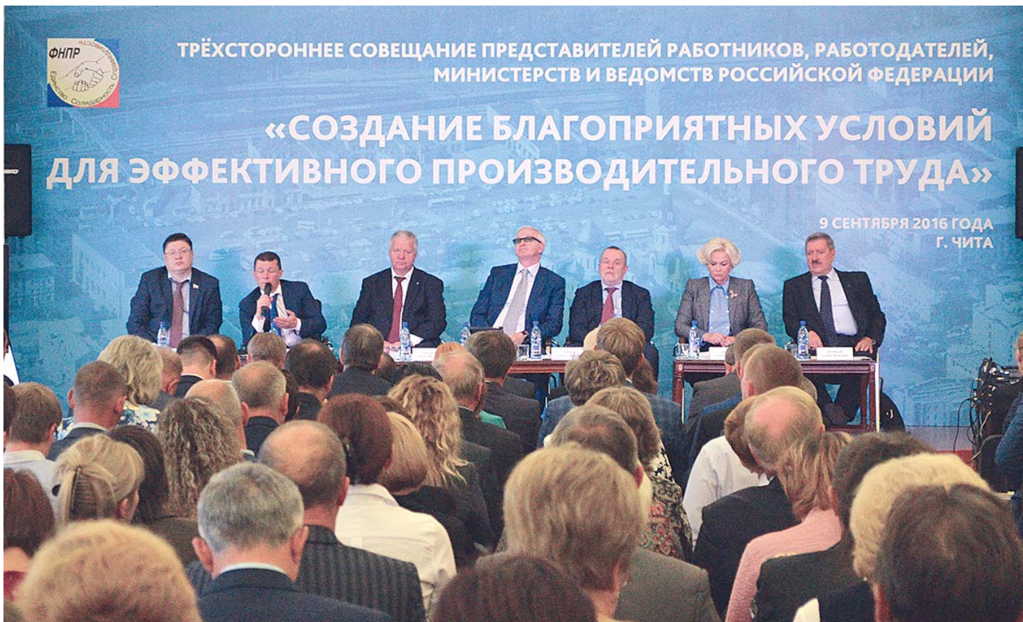
«Создание благоприятных условий для эффективного производительного труда» – тема состоявшегося 9 сентября в Чите Трёхстороннего совещания социальных партнёров с участием членов Правительства РФ. Подробности читайте на стр. 4-5