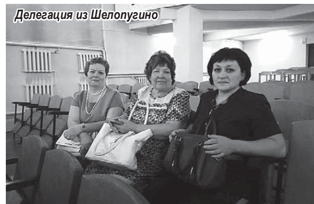
Делегация из Шелопугино