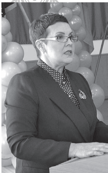
Окончание. Начало на стр. 1

21 ноября состоялось заседание Совета Федерации профсоюзов Забайкалья, посвящённое 70-летию со дня образования регионального профобъединения. Совет рассмотрел основные достижения, возможности и перспективы профсоюзов края.