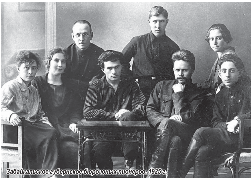
Забайкальское губернское бюро юных пионеров. 1925 г.