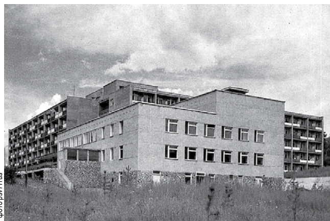
Санаторий «Дарасун» – крупнейшая здравница Забайкалья. Фото 1985 г.

успехом, были достаточно хорошие условия для лечения и отдыха. Путёвки выдавались нашим профсоюзом, и стоимость их была очень малая.