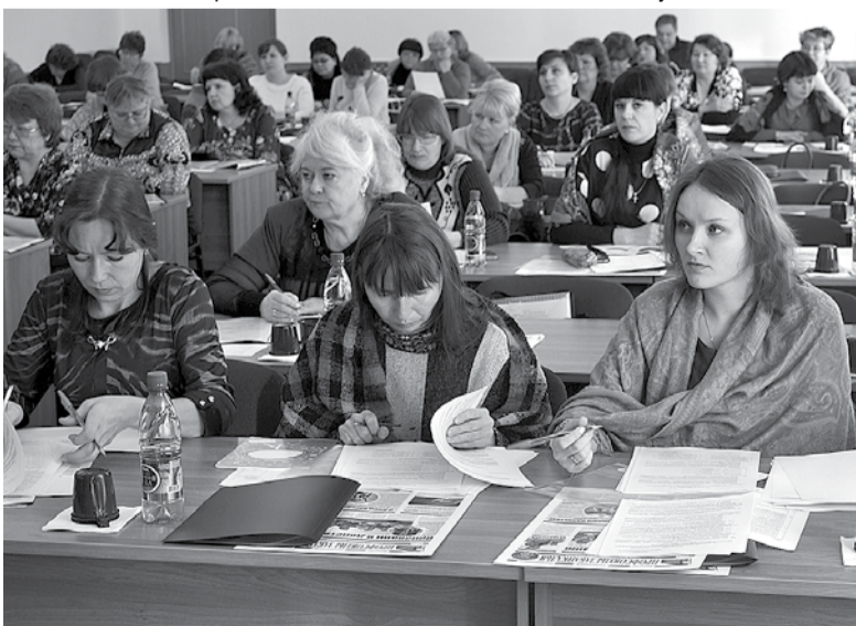
Процесс обучения профсоюзных кадров ежегодно охватывает десятки тысяч человек